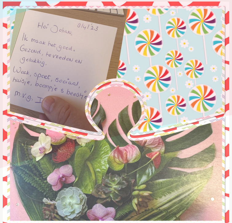
Een bedankje van een cliënt na 2 maanden afsluiten van het traject.

Klik hier voor mijn review in beeld via Youtube